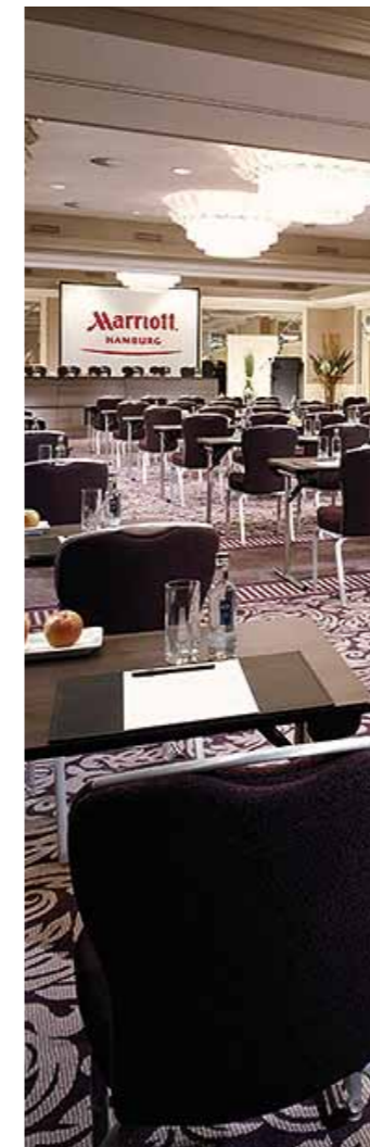
6. ETAGE 6TH FLOOR